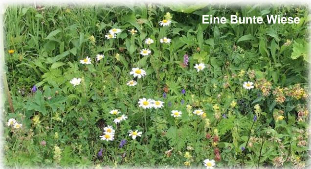
Eine Bunte Wiese

Das „ bunt “ in „Bunte Wiese“ steht nicht nur für „ Farbenvielfalt “, sondern vor allem für „ Artenvielfalt “! Mit diesem Flyer geben wir Ihnen Tipps und Tricks auf den Weg, wie Sie Ihren eignen Garten insektenfreundlicher gestalten können.