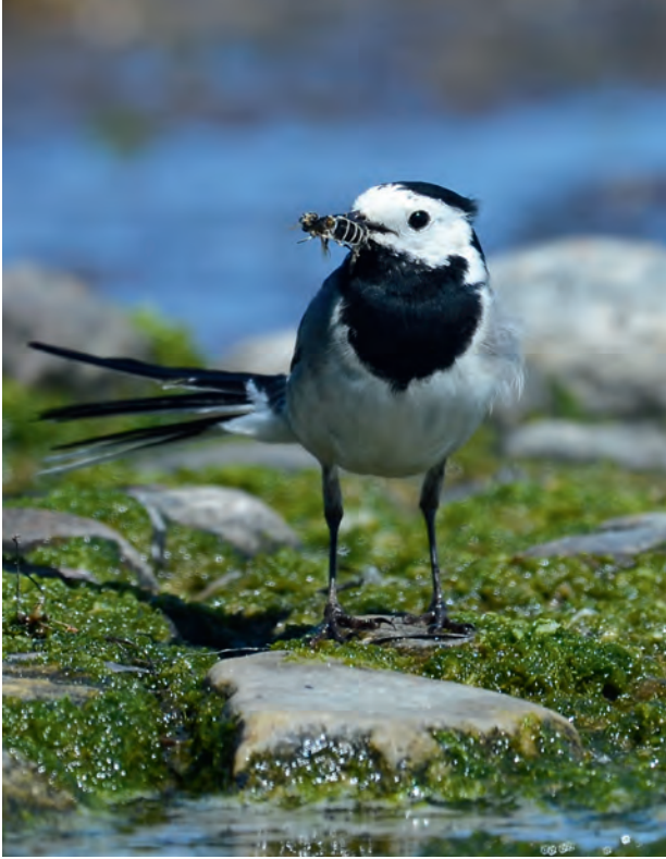
Ohne Insekten auch keine Insektenfresser: Die Bachstelze gehört zu den zahlreichen Vogelarten, die auf die Erbeutung von Insekten spezialisiert sind – in diesem Fall wurde eine Schwebfliegenart mit wasserlebenden Larven erbeutet.

Wenn es schon in Schutzgebieten so aussieht – mit welchen Werten müssen wir in der offenen Landschaft rechnen?