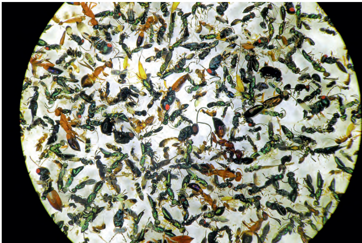
Nur wenige Spezialisten sind in der Lage, Proben aus Malaisefallen auszuwerten und alle Insekten richtig zuzuordnen. Hier hat eine Expertin die in einer Probe aus Israel enthaltenen Erzwespen ausgelesen. Die exakte Bestimmung einzelner Arten ist eine Herausforderung und führt auch heute noch selbst in Baden-Württemberg regelmäßig zur Beschreibung bisher unbekannter Arten.

und bodenlebende Arten finden sich in den Fängen allerdings naturgemäß kaum; dafür wurden andere Methoden entwickelt. Ein Problem der Malaisefallen ist die Menge von Material bzw. das Fehlen von Spezialisten, die in der Lage sind, alle Individuen auszulesen und zu bestimmen. Meist werden nur bestimmte Gruppen ausgelesen und ausgewertet; der große Rest wandert in die Magazine von Forschungseinrichtungen und bleibt damit erhalten und auswertbar. Wie andere Forscher durchsuchten auch die Krefelder die Fänge ihrer Malaisefallen nach ihren speziellen Forschungsobjekten. Vorher taten sie aber etwas scheinbar Banales: Sie wogen die Proben als gesamtes. Und genau das lieferte das brisante Ergebnis, das die Welt erschütterte. Betrug die mittlere Biomasse der Insekten, die in die Falle gegangen waren, am Anfang der Studie im Jahr 1989 noch 10 g pro Tag, so waren es am Ende im Jahr 2016 nur noch 2,5 g, ein Rückgang von 75 Prozent! Erschreckend ist dabei nicht nur der enorme Rückgang, sondern auch, dass die Untersuchung in Schutzgebieten stattgefunden hat, also genau dort, wo wir versuchen, möglichst unbeeinflusst von negativen äußeren Einwirkungen eine maximale Artenvielfalt zu erhalten. Die Frage drängt sich auf: