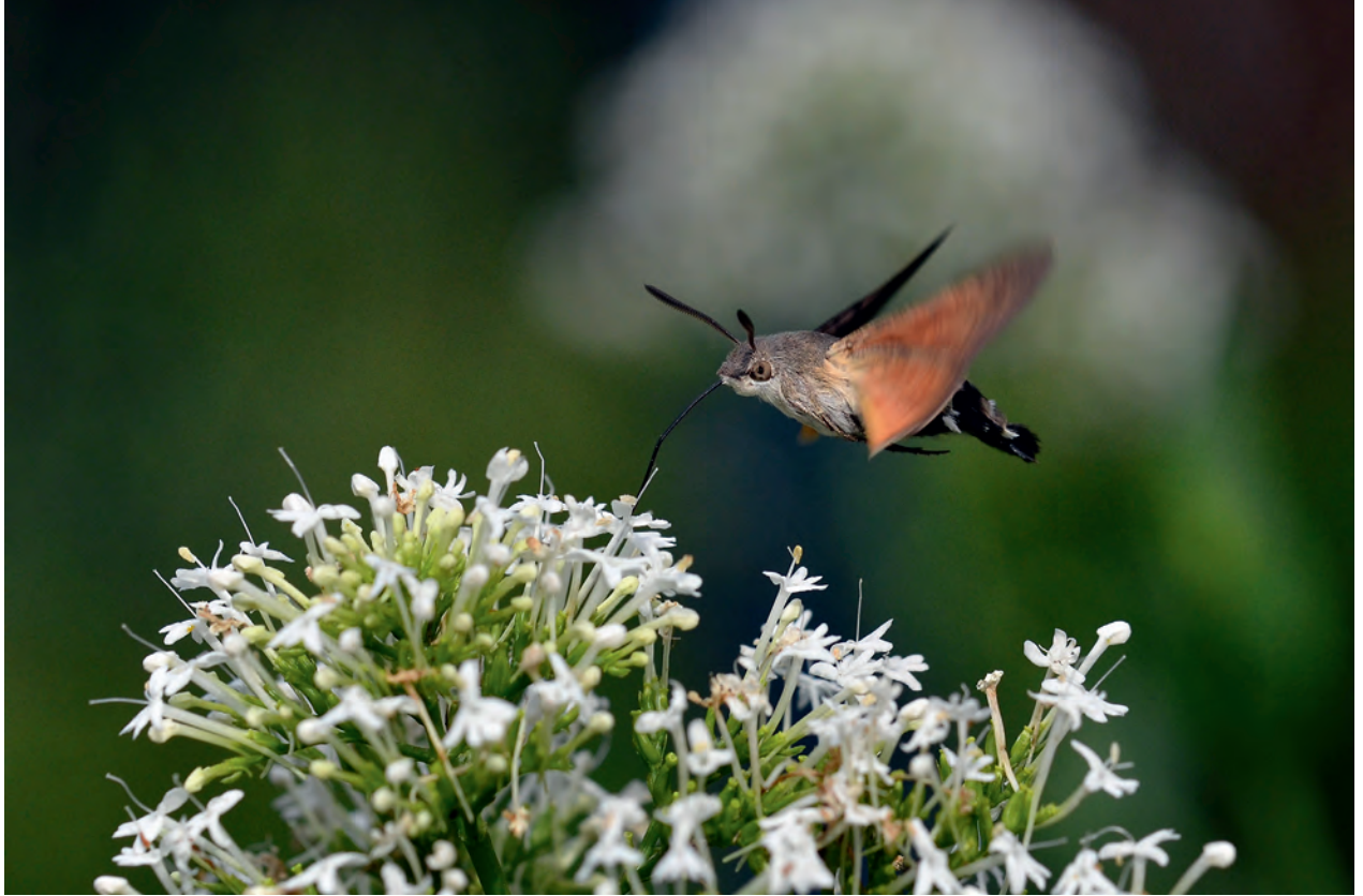
Faszinierende Begegnung im insektenfreundlichen Garten – ein Taubenschwänzchen ( Macroglossum stellatarum ). Kolibriartig schwirrt der tagaktive, zu den Schwärmern gehörende Nachtfalter vor Blüten und trinkt Nektar.