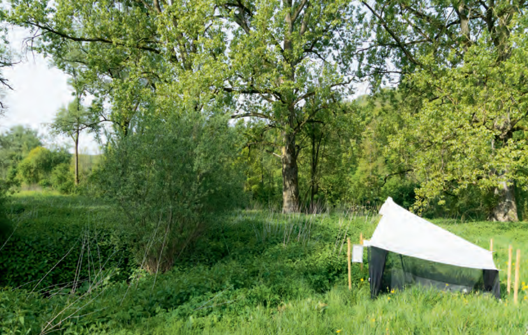
Malaisefallen dienen zur standardisierten Erfassung von Fluginsekten. Das schwarze Netzgewebe stoppt den Flug der Insekten, die dann nach oben ausweichen und schließlich in einen an der Spitze des Zeltdachs montierten Sammelbehälter gelangen.

Trend steht. Das belegten einerseits andere aktuelle Studien. Andererseits konnte man zurückgreifen auf viele Forschungsergebnisse der letzten Jahrzehnte, die seinerzeit kein über Insiderkreise hinausgehendes Aufsehen erregt hatten, sich nun aber in ein globales Muster einordnen ließen. Ohne diese lange Zeit kaum wahrgenommene Forschung und die in naturkundlichen Museen archivierten Belegstücke hätten wir heute schlicht keine Daten und damit keine Möglichkeit, historische Biodiversität zu rekonstruieren und einen Vergleich zu heute anzustellen – eine absolute Notwendigkeit, um langfristige Veränderungen fundiert zu rekonstruieren. Es ist ein Versäumnis der (professionellen) Wissenschaft, dass sie keine Metastudien anfertigte, die diese Trends statistisch gesichert zusammenfassten. Sicher spielt dabei auch eine Rolle, dass viele lokale und regionale Bestandserfassungen von engagierten Amateuren wie den Krefelder Entomologen durchgeführt wurden, die, obwohl oft mit enormem Sachverstand absolut professionell durchgeführt, weitgehend unter dem Radar der universitären Wissenschaft blieben. Erst 2020 kommen van Klink et al. nach der Auswertung von 166 solcher weltwei-