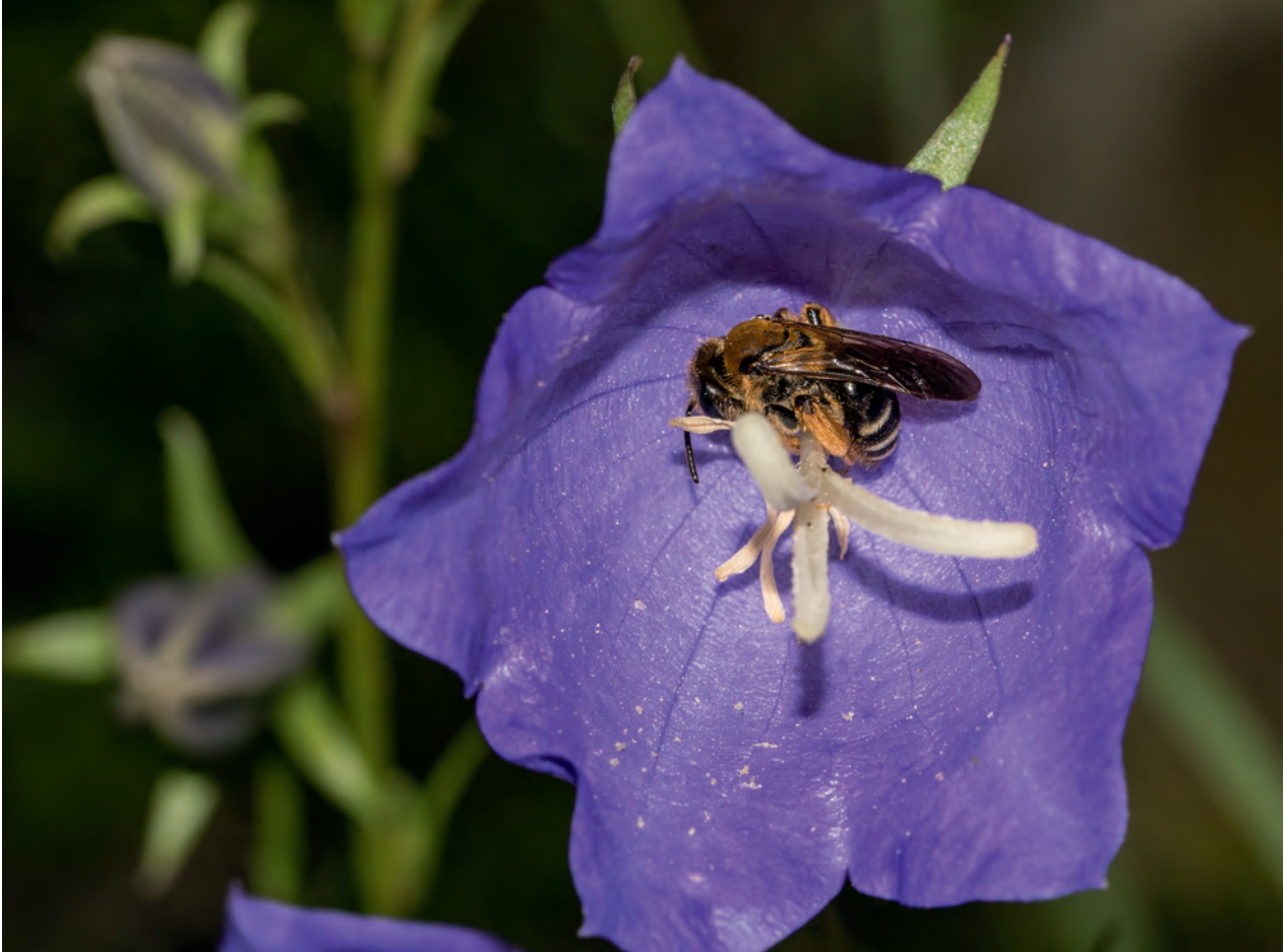
Die meisten Insektenarten sind hoch spezialisiert: Die Braunschuppige Sandbiene Andrena curvungula besucht ausschließlich Glockenblumengewächse, um Pollen und Nektar zu sammeln. In Baden-Württemberg steht sie als «gefährdet» auf der Roten Liste.

Großbritannien wurde geschätzt, dass jedes Jahr 1 bis 4 Milliarden dieser migrierenden Schwebfliegenarten ein- und auswandern, deren Larven 3 bis 10 Billionen Blattläuse vernichten (Wotton et al. 2019).