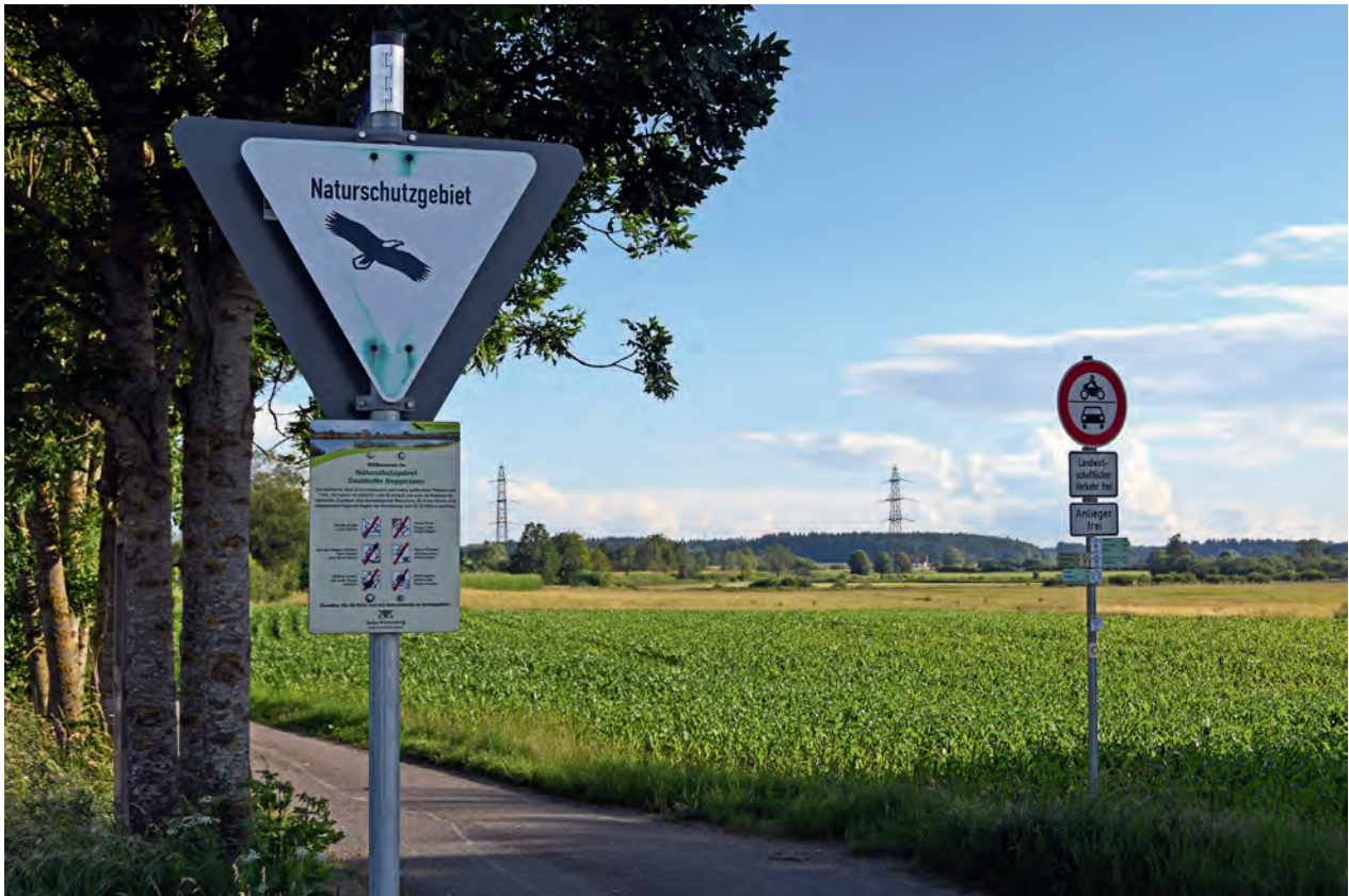
Maisfeld statt Wiese: In vielen Naturschutzgebieten bleibt, so wie hier in einem oberchwäbischen Feuchtgebiet, intensive landwirtschaftliche Nutzung inklusive Dünger- und Biozideinsatz erlaubt und konterkariert den Schutzzweck.

Für Wirbeltiere (und damit auch für uns Menschen) sind Neonikotinoide selbst zwar weit weniger giftig, aber sie wirken indirekt. Eine Studie aus den Niederlanden belegt zum Beispiel einen Zusammenhang zwischen der Konzentration von Neonikotinoiden im Oberflächenwasser, dem dadurch direkt ausgelösten Rückgang der wasserlebenden Insektenlarven und der entsprechenden Auswirkung auf insektenfressende Vögel wie Rauchschnalbe, Schafstelze oder Feldlerche (Hallmann et al. 2014).