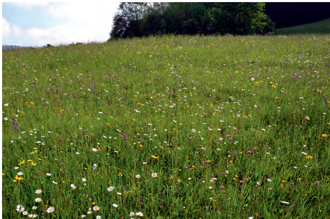
Ohne Pflanzenvielfalt keine Insektenvielfalt. Viele Insektenarten sind an bestimmte Pflanzenarten gebunden. Artenreiche Blumenwiesen wie diese bei Öschingen am Fuß der Schwäbischen Alb sieht man nur noch selten. Düngung und häufige Mahd machen aus bunten Wiesen artenarme Grasproduktionsstätten.

Zwar wirken systemische Gifte, die nicht flächendeckend ausgebracht, sondern über gebeiztes Saatgut von der Pflanze aufgenommen werden und dann direkt an daran saugende oder fressende Insekten weitergegeben werden, scheinbar sehr viel selektiver. Tatsächlich verbleiben bei den so ausgebrachten Neonikotinoiden aber mindestens 80 % im Boden und gelangen letztlich ins Grundwasser und auch die aufgenommenen Anteile treffen häufig Unbeteiligte, z.B. harmlose Blütenbesucher (Goulson 2013). Physiologisch unterscheiden auch moderne Insektizide wie die seit einigen Jahren verstärkt eingesetzten Neonikotinoide nicht zwischen Blattlaus und Honigbiene. Sie sind hochwirksam – etwa 7000-mal so wirksam wie das klassische, in Deutschland seit 1972 weitgehend verbotene DDT – und stören die Nervenreizleitung v.a. bei Insekten (Goulson 2013). Selbst wenn sie nicht unmittelbar tödlich wirken, kommt es zu Veränderungen im Verhalten: Bienen sind desorientiert und finden nicht mehr nach Hause in den Stock, parasitoide Erzwespen – wichtige Gegenspieler anderer Insekten – finden weder ihre Geschlechtspartner noch ihre Wirte, beides unabdingbar für eine erfolgreiche Fortpflanzung (Tappert et al. 2017).