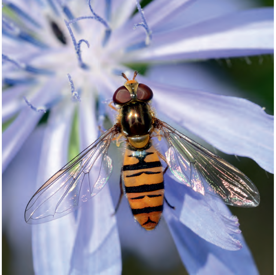
Die Schwebfliege Episyrphus balteatus ist eine unserer häufigsten Schwebfliegenarten. Sie ist hoch mobil und spielt eine große Rolle sowohl als Bestäuber als auch bei der biologischen Schädlingsbekämpfung: Jede Larve vertilgt innerhalb weniger Tage bis zu 1000 Blattläuse.

In diesem Zusammenhang ein Wort zur Honigbiene: In der öffentlichen Diskussion zum Thema Insektensterben neigen manche Protagonisten zu einer gewissen Horizontverengung. Aus «Stoppt das Insektensterben» wird «Rettet die Bienen» – mit diesem Slogan gingen die von Imkern tatkräftig unterstützten bzw. sogar initiierten Volksbegehren in Bayern und Baden-Württemberg an den Start. Fokussiert wurde insbesondere auf eine einzige Art: die Honigbiene. Es mag aus Gründen des Marketings opportun sein, auf ein Insekt zu setzen, das von der Biene Maja bis zum Honigbrot als Sympathieträger gilt. Den Kern der Sache trifft es aber nicht. Denn im Gegensatz zu fast allen anderen 33.800 Insektenarten in Deutschland ist die Honigbiene kein Wild-, sondern ein Haustier, sozusagen eine «fliegende